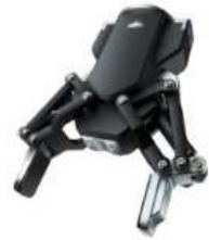
DH-Robotics Adaptive Gripper AG-95 TM Kit