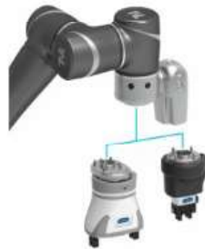
Electric gripping by SCHUNK – Plug & Work Portfolio Techman Robot