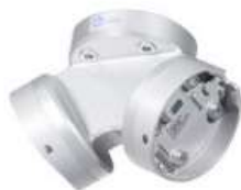
OnRobot Dual Quick Changer