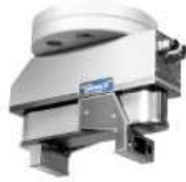
SCHUNK Gripping System for TM- WSG32