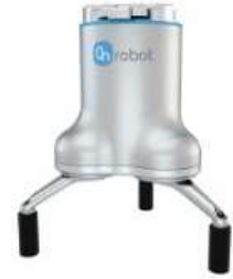
OnRobot: 3-FINGER GRIPPER (3FG)