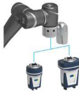
Collaborative gripping by SCHUNK – Plug & Work Portfolio Techman Robot