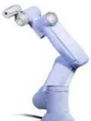
NABELL Robot Flex