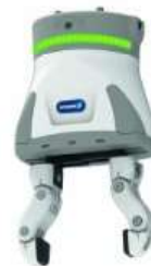
SCHUNK gripper EGH in starter kit for TM