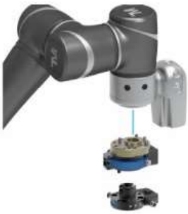
Changing by SCHUNK – Plug & Work Portfolio Techman Robot