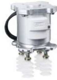
SMC Vacuum Gripper Unit for Collaborative Robots