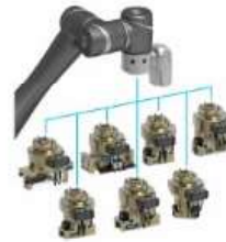
Pneumatic gripping by SCHUNK – Plug & Work Portfolio Techman Robot