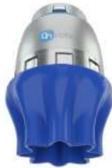
OnRobot: Soft Gripper (SG)