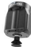
Robotiq Vacuum Gripper EPick