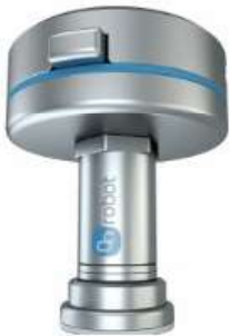
OnRobot: Gecko Single Pad (SP) Gripper