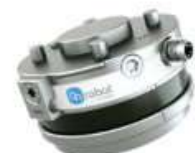
OnRobot HEX-E / HEX-H