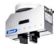
SCHUNK Gripping System for TM – WSG50