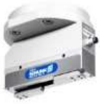
SCHUNK Gripping System for TM WSG-25