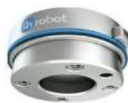
OnRobot Quick Changer