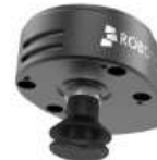
Robotiq Vacuum Gripper AirPick