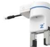
Zimmer HRC-03 TM-Kit