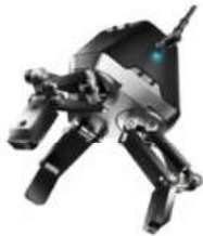
DH-Robotics Adaptive Gripper DH-3 TM Kit